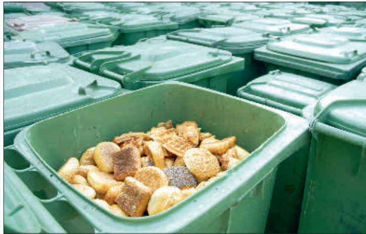
Erfreulich: In Biotonnen landen weniger Fremdstoffe.